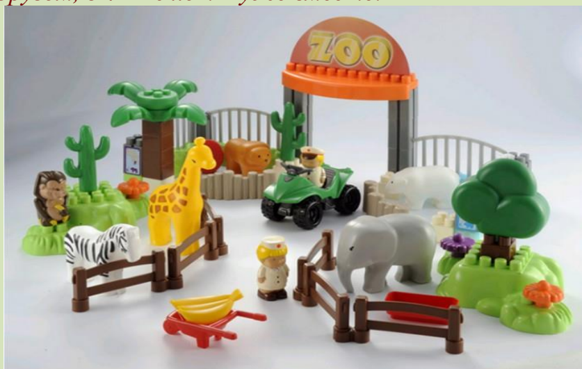
Игрушки для режиссерской игры «Зоопарк».

ВАЖНО: Режиссерская игра у двухлеток — предпосылка сюжетно-ролевой игры у детей более старшего возраста. В 2 — 3 года дети, обычно, играют рядом друг с другом, в 4 — 6 лет — уже вместе.